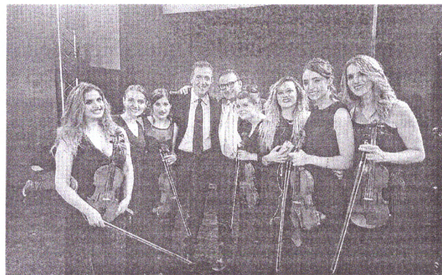
simo Ranieri, Mino Reitano e Albano